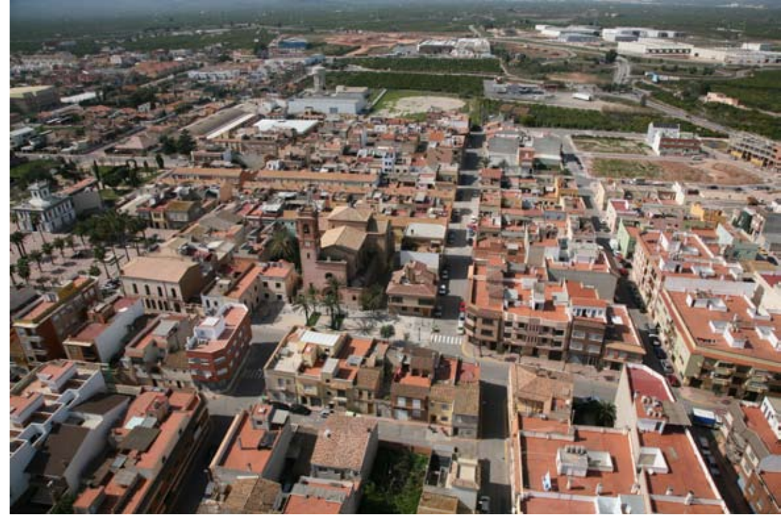
ALQUERÍAS DEL NIÑO PERDIDO (Castellón)